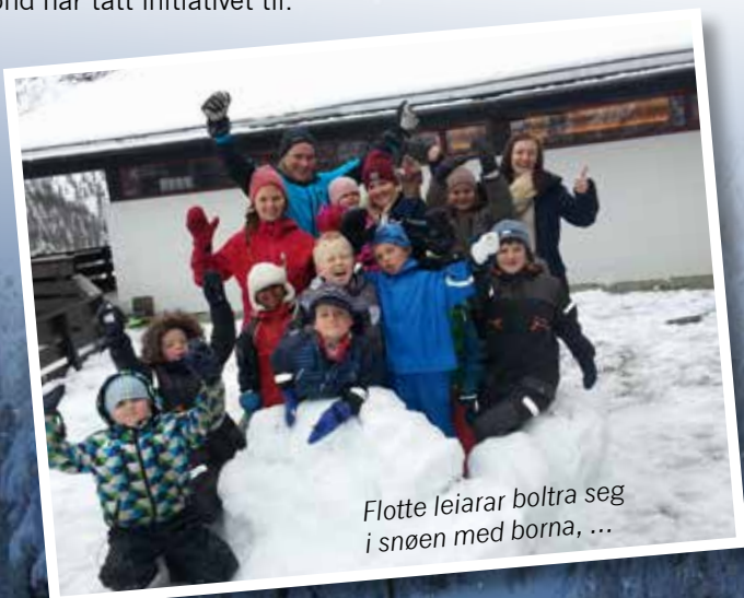
Flotte leiarar boltra seg i snøen med borna, ...