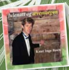
Jule-CD frå Knut Inge Røen Kr. 100,-