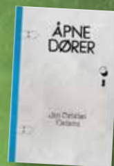
Lettlest for ungdom