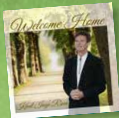
Ny CD frå Knut Inge Røen: Welcome Home Kr. 150,-