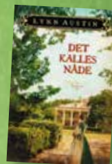
Nydeleg roman Kr. 329,-