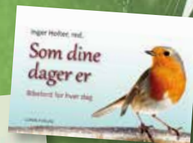
Nye evighets- kalenderar Kr. 198,-