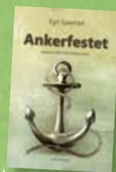
Ny andaktsbok frå Egil Sjaastad Kr. 298,-