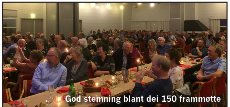
God stemning blant dei 150 framømte