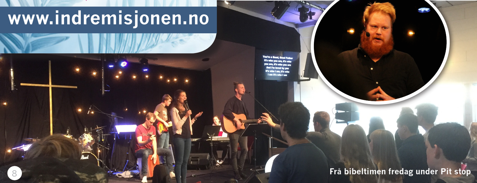
Frå bibeltimen fredag under Pit stop