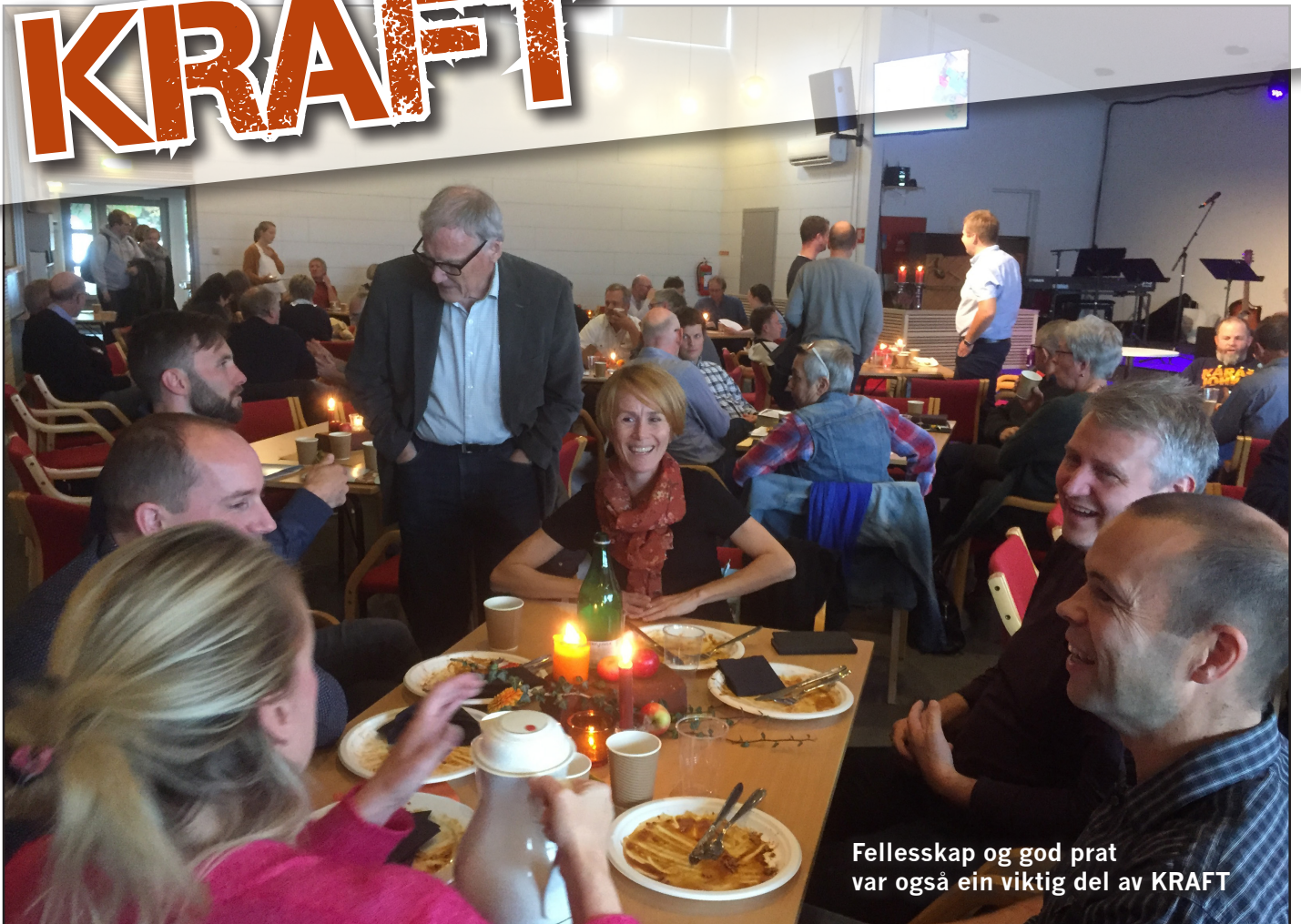
Fellesskap og god prat var også ein viktig del av KRAFT

29. september var dagen komen som fleire av oss hadde sett fram til og jobba for; teneste- og leiarkonferanse på Leirvik bedehus. Den hadde fått namnet KRAFT. Det var gledeleg at hovudsalen vart fylt opp av engasjerte personar i arbeidet lokalt.