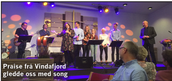
Praise frå Vindafjord gledde oss med song