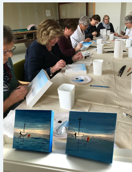
Flotte resultat frå malekurset på Damehelga.

Tekst: Marie Rekve