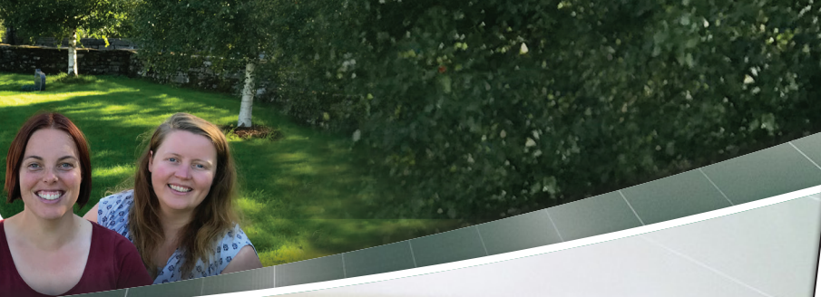
Synnøve Wold-Flokketvedt - Linda Aase Ung-leiar Ung-arbeidar