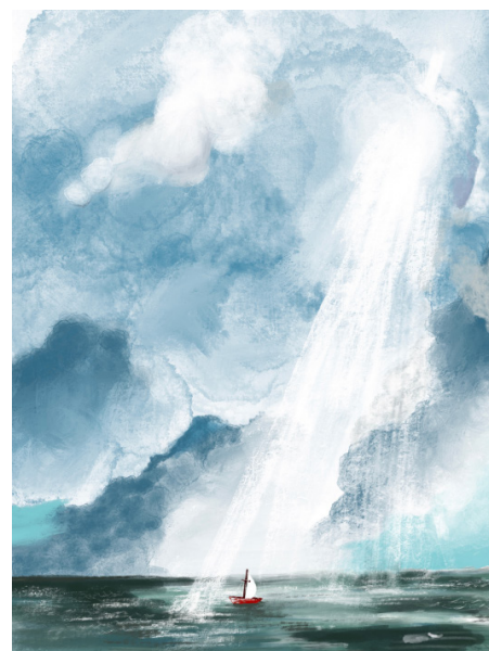
«Small boats» av Sarah Grant.

Kva er ropet eller behovet på din heim plass? Kan du gjenkjenna nokon behov som Gud kan leia inn i? Dette var spørsmål me fekk til å grunna på under konferansane. Korleis kan me la Guds rike koma, og la Hans vilje skje (Matt. 6, 10)?