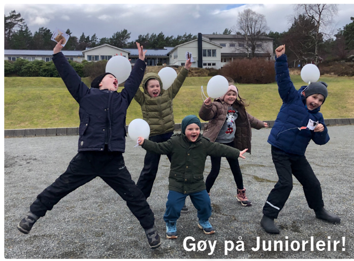
Gøy på Juniorleir!