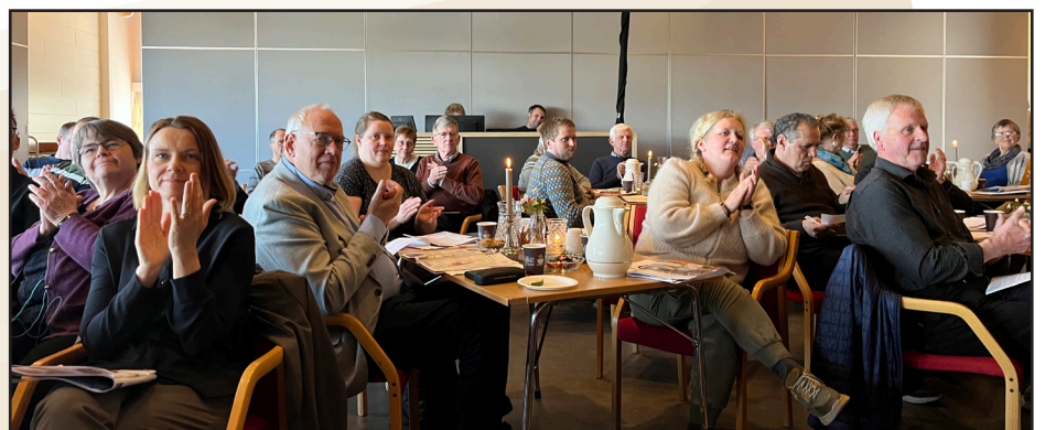
73 utsendingar var møtt fram til årsmøtet.