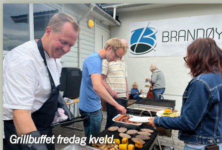
Grillbuffet fredag kveld.