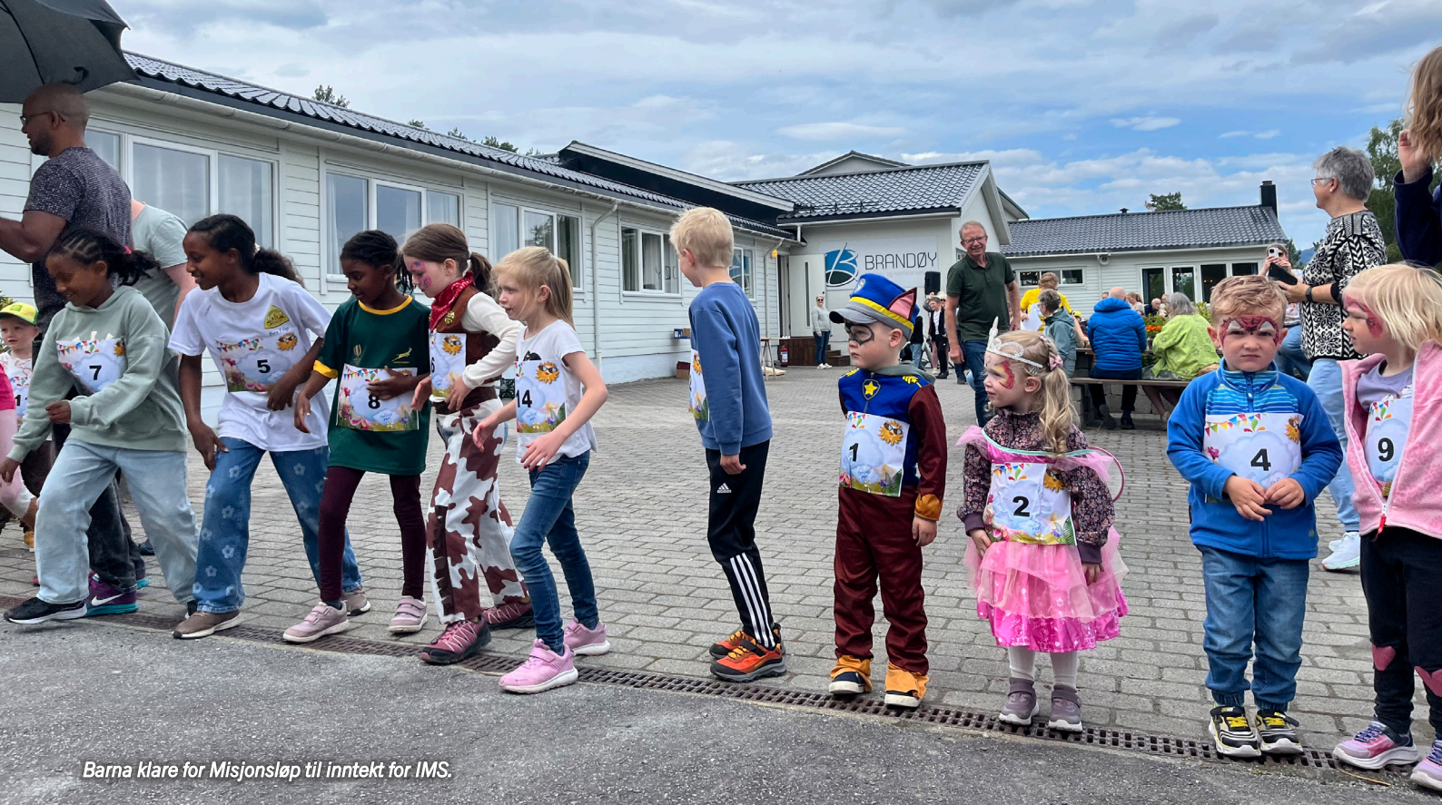
Barna klare for Misjonsløp til inntekt for IMS.

bidrog til å gi IMS sitt viktige leirarbeid ei flott håndsrekning!